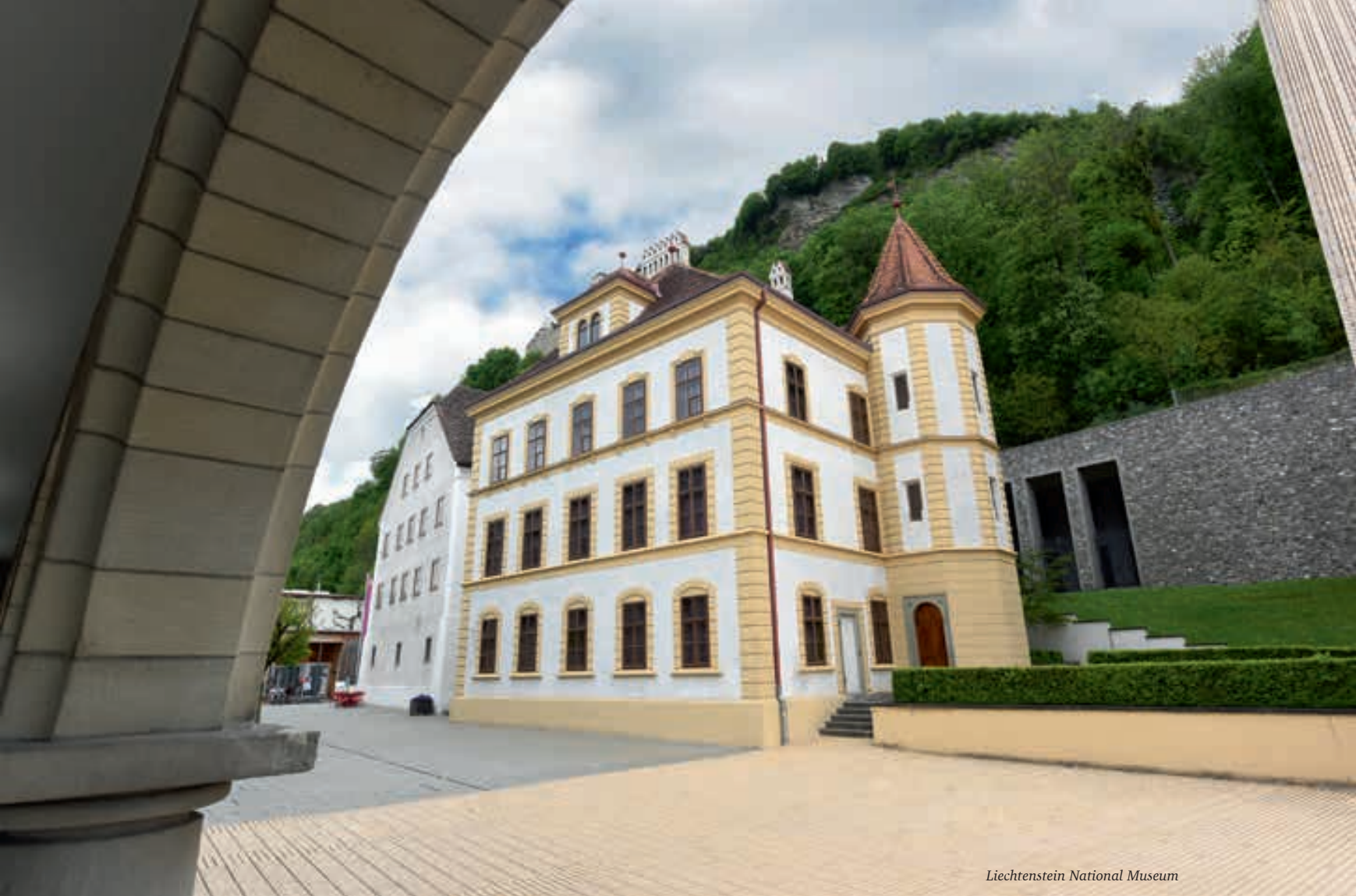
Liechtenstein National Museum

лена коллекция сокровищ и документов XVIII столетия, многие предметы принадлежали княжеской семье, также были представлены шпага Петра Великого, которую он получил в подарок в Голландии и затем подарил Августу Сильному, и портрет Петра Великого из эмали, изготовленный придворным ювелиром Динглингером во время посещения царем Дрездена. Данные предметы были предоставлены Дрезденской оружейной палатой и Княжеской сокровищницей в Дрездене.