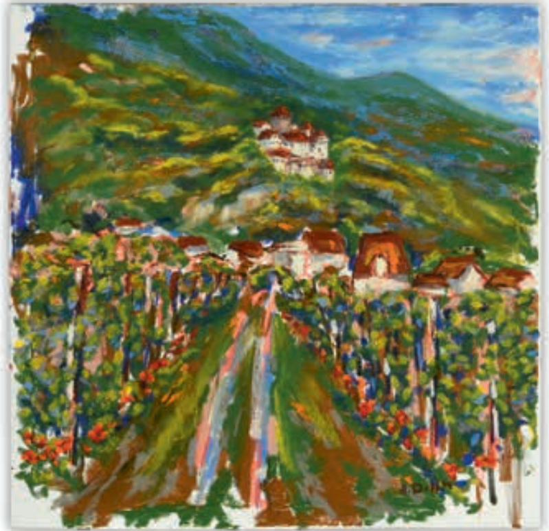
Castle of Vaduz